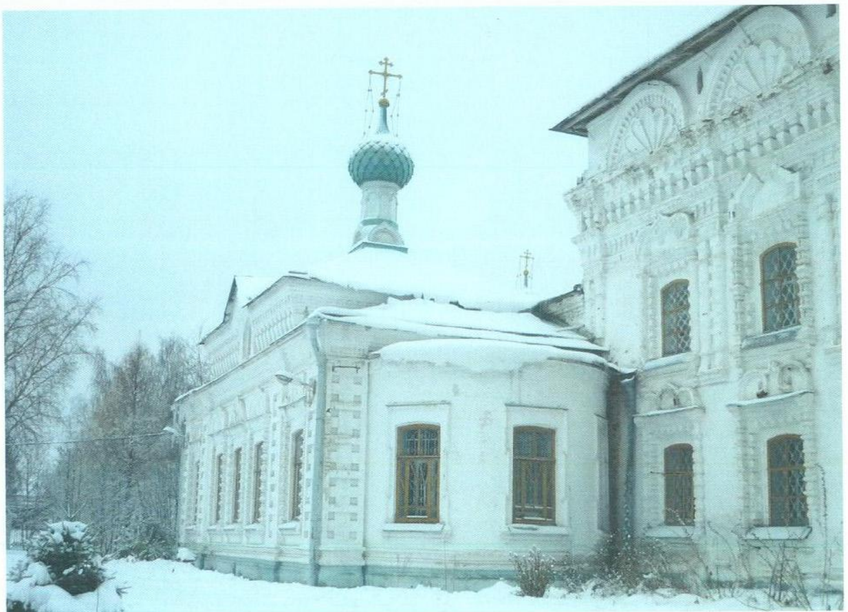
Фото 3. «Церковь Екатерининская, 1699 г.», г. Слободской, ул. Володарского, д. 54. Вид с юго-востока. Дата – 02.11.2015.