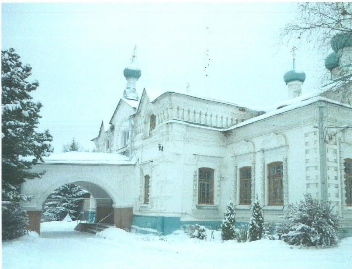
Фото 1. «Церковь Екатерининская, 1699 г.», г. Слободской, ул. Володарского, д. 54. Вид с юго-запада. Дата – 02.11.2015.