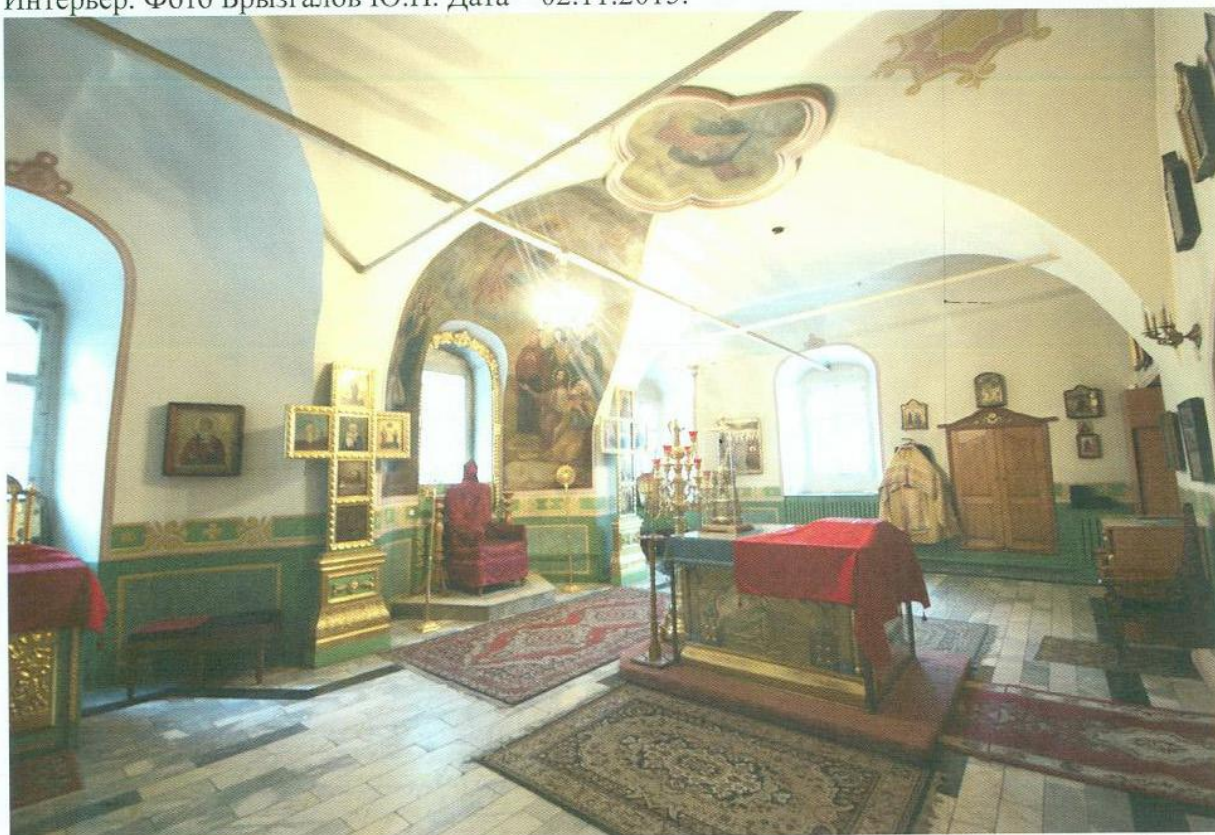
Фото 13. «Церковь Екатерининская, 1699 г.», г. Слободской, ул. Володарского, д. 54. Интерьер. Дата – 02.11.2015.