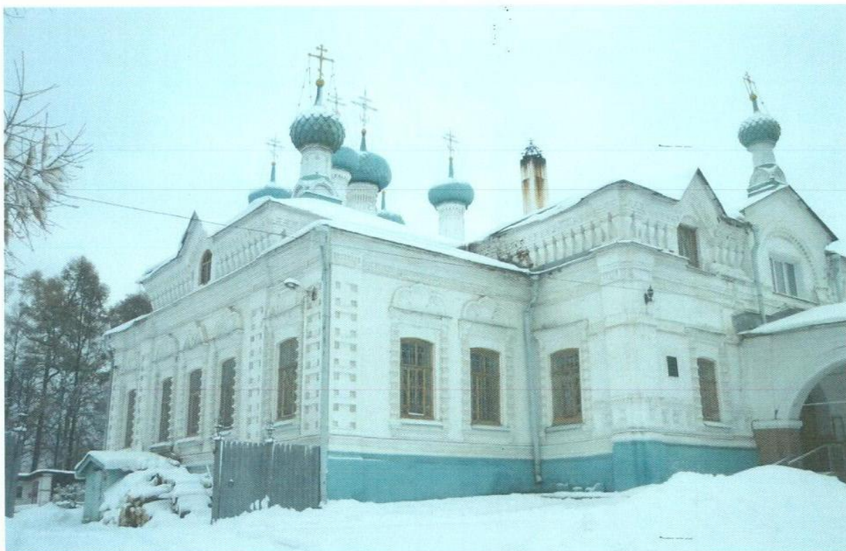
Фото 6. «Церковь Екатерининская, 1699 г.», г. Слободской, ул. Володарского, д. 54. Вид с северо-запада. Дата – 02.11.2015.