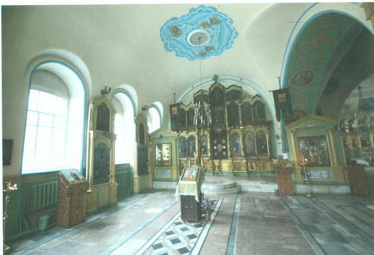
Фото 12. «Церковь Екатерининская, 1699 г.», г. Слободской, ул. Володарского, д. 54. Интерьер. Дата – 02.11.2015.