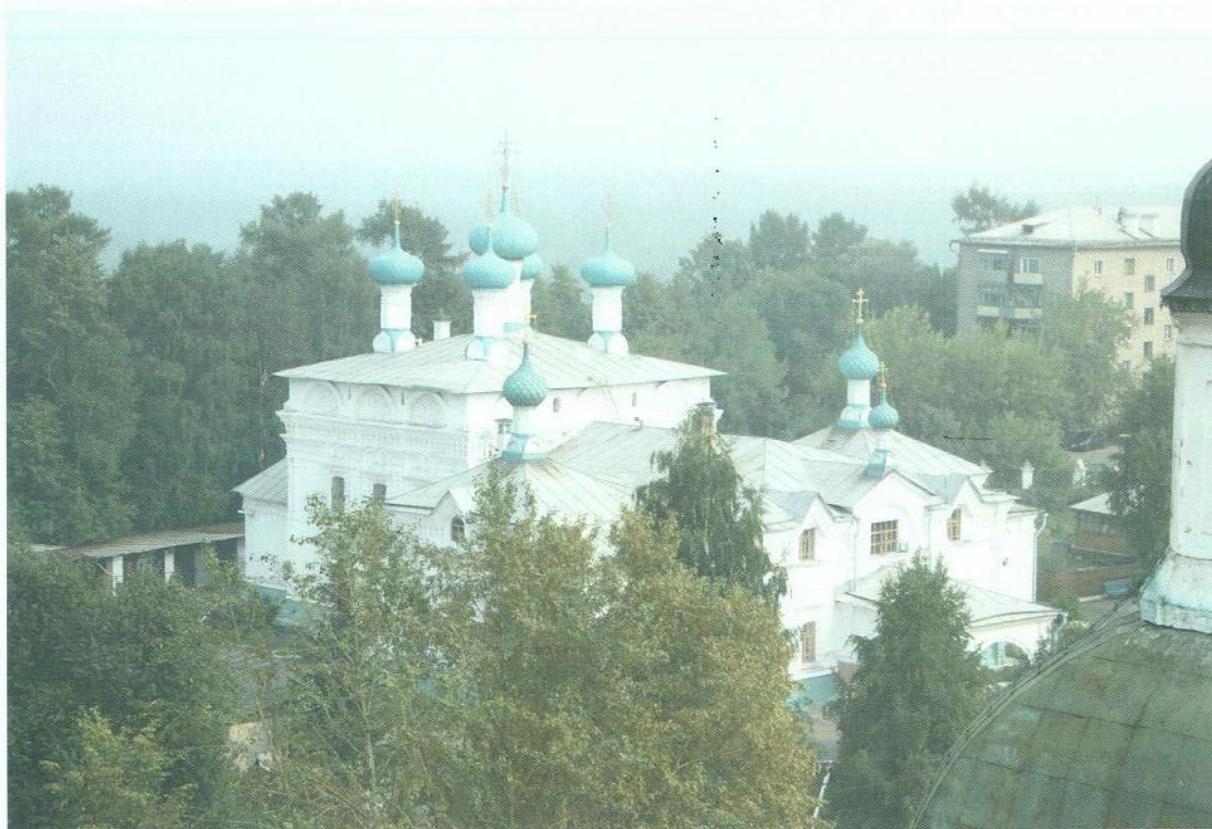
Фото 7. «Церковь Екатерининская, 1699 г.», г. Слободской, ул. Володарского, д. 54. Вид сверху, с северо-запада. Дата – 07.07.2014.