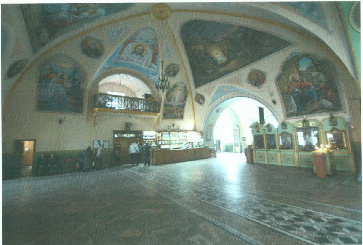
Фото 10. «Церковь Екатерининская, 1699 г.», г. Слободской, ул. Володарского, д. 54. Интерьер. Дата – 02.11.2015.