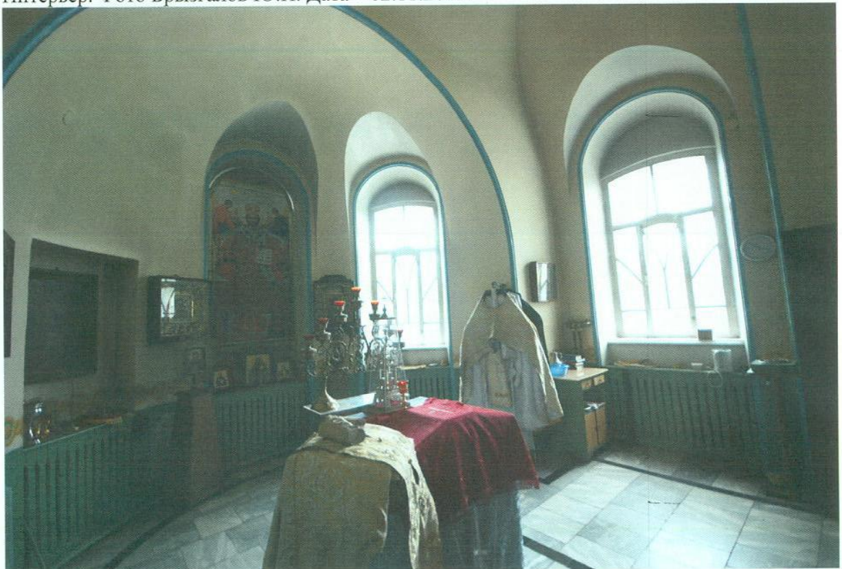
Фото 11. «Церковь Екатерининская, 1699 г.», г. Слободской, ул. Володарского, д. 54. Интерьер. Дата – 02.11.2015.