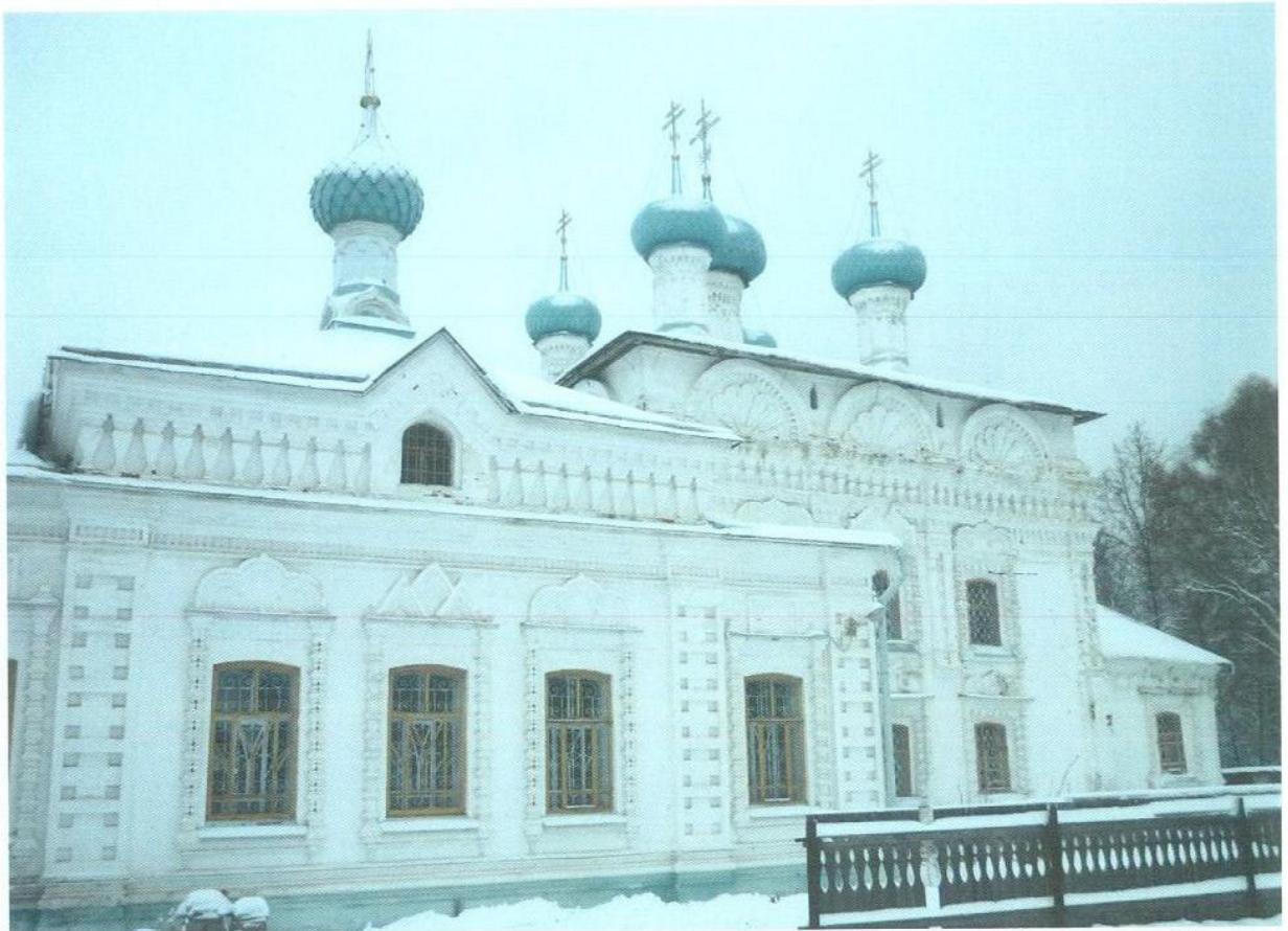
Фото 2. «Церковь Екатерининская, 1699 г.», г. Слободской, ул. Володарского, д. 54. Вид с южной стороны. Дата – 02.11.2015.