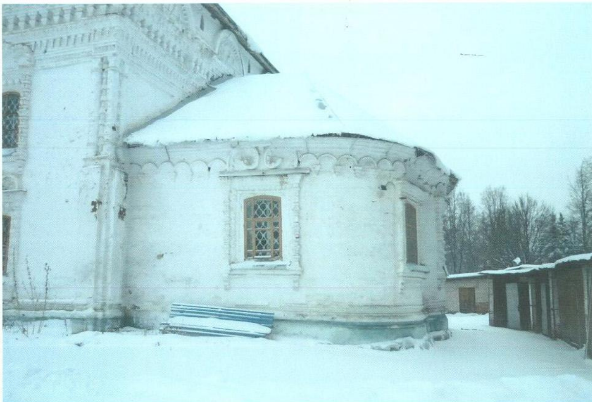
Фото 4. «Церковь Екатерининская, 1699 г.», г. Слободской, ул. Володарского, д. 54. Вид на апсиду. Дата – 02.11.2015.