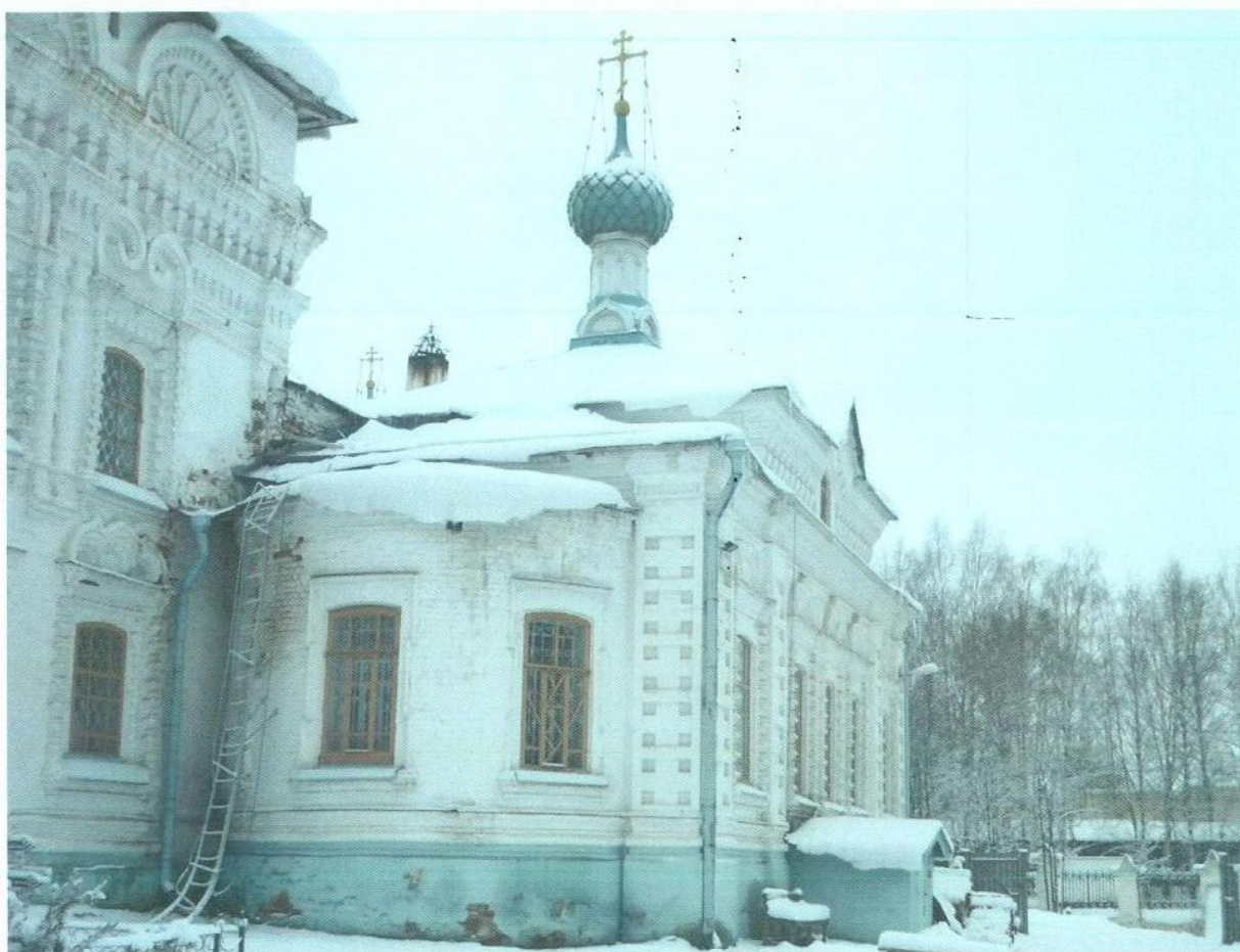
Фото 5. «Церковь Екатерининская, 1699 г.», г. Слободской, ул. Володарского, д. 54. Вид с северо-востока. Дата – 02.11.2015.